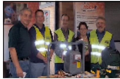
Mayor Goettel con voluntarios de CERT

Seguridad Publica de Richfield ha inaugurado el entrenamiento del Equipo de Respuesta a Emergencia